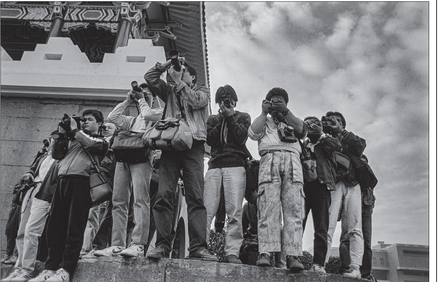
▲1987年，街頭攝影記者