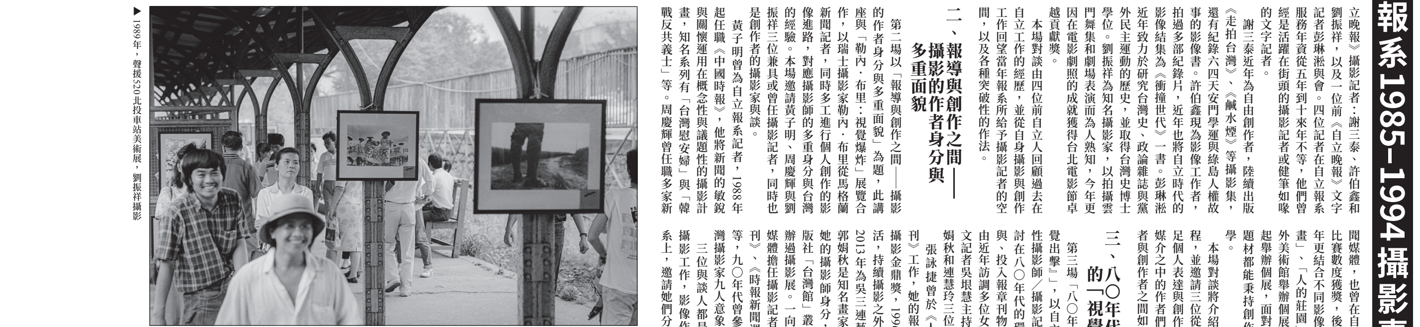
▲1989年，台北投車站美術展

第四場講題為「副刊與紙媒時代的攝影——載體的意義」，從攝影史的視角切入，邀請《台灣攝影史形構考》作者、攝影家郭力昕回應與談。