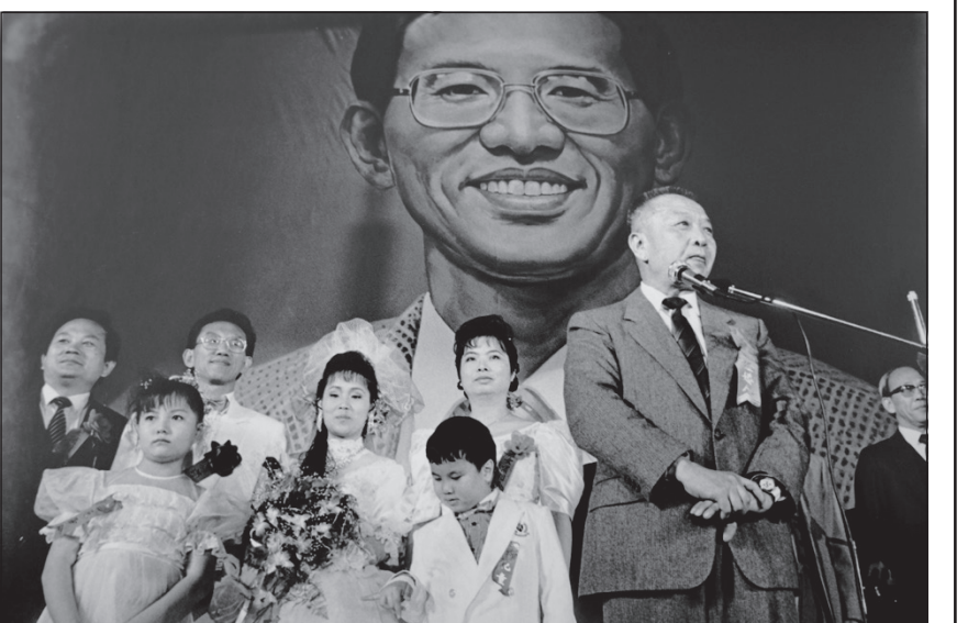
▲1990年3月20日，士林夜市旁廣場

團體為主的攝影創作，加入了許多在媒體工作的攝影記者，因專題報導而搭配的影像圖片，它們在現實意義之外，也可能深具美學性與創作主體性。隨著報導攝影的逐漸繁榮，到了八〇年代，街頭成為追求民主化與各種社會運動的戰場，不僅吸引攝影工作者投入，許多關懷社會與黨外運動的媒體也善用影像的力量，開闢更多的影像版面。八〇年代中期，自立晚報不僅逐漸重視攝影，也關注新聞攝影的新議題，及至二〇〇〇年禁解除，媒體進入新一輪的群雄競爭時代，原先只有《自立晚報》的自立報系於同年一月創立《自立早報》（1988-1990）。延續對攝影的關懷，在創立當年即宣佈舉辦開放後的第一個「台灣年度最佳新聞攝影獎」，吸引許多業餘與專業攝影者參加比賽，激勵報導攝影者的水準提昇。