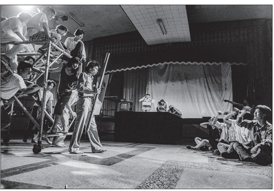
▲1989年，韓捷S20攝影棚

只是，上報紙的影像邏輯以配合文字為主，圖片數量難免有所限制。在這種狀況下，特別是廣告版面較少的週日，《自立晚報》與《自立早報》俱推出以圖片為主的版面。