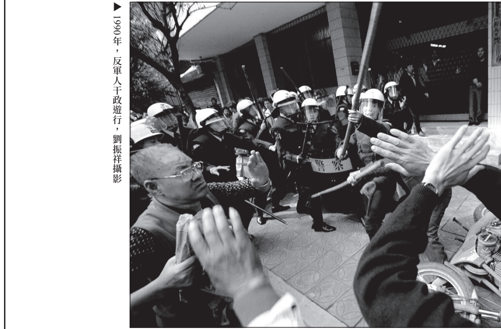
▲1990年，反軍人干政遊行

1989年耕莘文教院的「武、武、武」劇作，就是小劇場工作者對S20運動的回應表達，當晚演出有事先的宣傳，許多關注S20農民議題的非劇場觀眾也前來觀賞。劇中演出者裝扮警察衝進來拘押演員，觀眾以為真的警察衝進來，就與劇場警察對抗，形成一股強烈的張力。