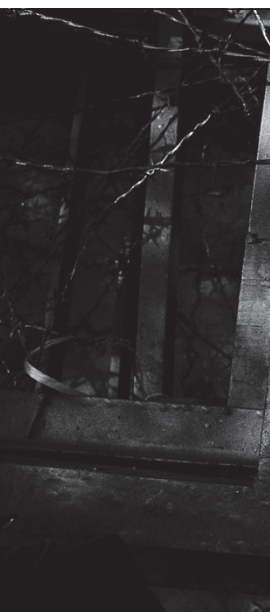
▲1989年，黑名單