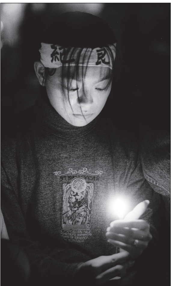
▲1991年4月19日，臺大校門口